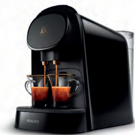
CAFETERA PHILIPS 59€

ASTERIA COMPLET 2.000 W. 2 en 1: Grill + tabla de asar. Tapa basculante. Placas extraíbles y antiadherentes. Cód. 121058