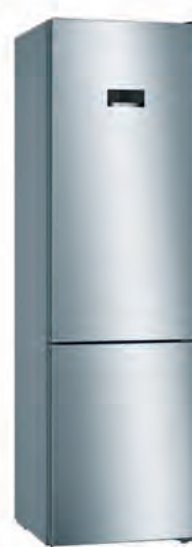
COMBI BOSCH 789€

EC 2010 NFDW/A (blanco) EC 2010 NFDI/A (inox) No Frost total. Clasificación energética E. Control electrónico con display en puerta. Dimensiones 201x59,5x63 cm. Cód. 117156/117157