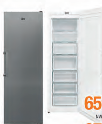
CONGELADOR NEW POL 659€ 679€

CA242BF Estático. Clasificación energética F. Mecánico. 7 cajones. Dimensiones 170x60x60 cm. Cód. 127494