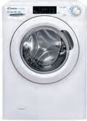
LAVADORA CANDY 389€

CSO 14105TE/1-S 10 kg. 1.400 r.p.m. Clasificación energética E. 16 programas. Ciclos rápidos. Inicio diferido. Conectividad mediante app. Cód. 118268