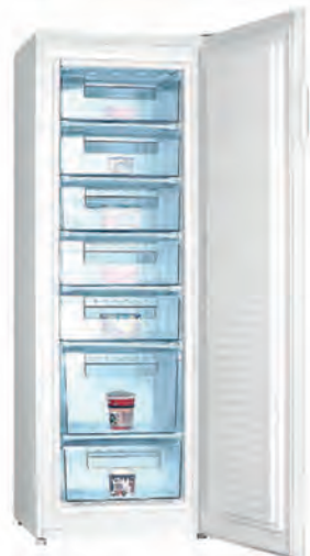
CONGELADOR FRIGELUX 499€

TOP CV135NXA++ Estático. Clasificación energética E. Mecánico. 3 cajones. Acabado negro + look inox. Dimensiones 84,6x54,5x53 cm. Cód. 127496