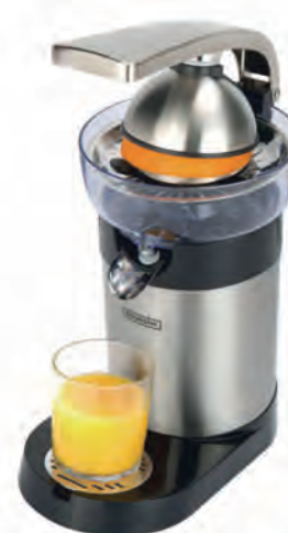
EXPRIMIDOR BOURGINI 89€

BA5606 1.000 W. Regulador de velocidad. Función turbo. Pica hielo. Cuchillas de alto rendimiento. Campana antisalpicaduras. Cód. 118437