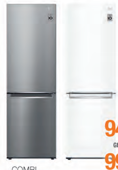
COMBI LG 949€ 999€

KGN39MLEB No Frost. Clasificación energética D. VitaFresh. Tirador vertical integrado. Puertas acero antihuellas. Electrónica en puerta. Dimensiones 203x60x66 cm. Cód. 127550