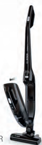
ASPIRADOR ESCOBA BOSCH 129€

CUBIK HYDRO 8 Multifunción (8 funciones). Clasificación energética A. Capacidad 71 litros. Cód. 121281