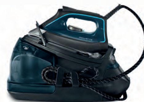
CENTRO PLANCHADO ROWENTA 269€

694 2 cepillos multisuperficie. Dirt Detect. Wifi. Cód. 128057