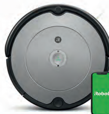
ROBOT ASPIRADOR ROOMBA 249€

BBH3ZOO28 PROANIMAL 25,2 V. 2 en 1: aspirador escoba y aspirador de mano. 2 niveles de aspiración. Autonomía hasta 55 minutos. Iluminación LED integrada. Cepillo motorizado. Cód. 124294