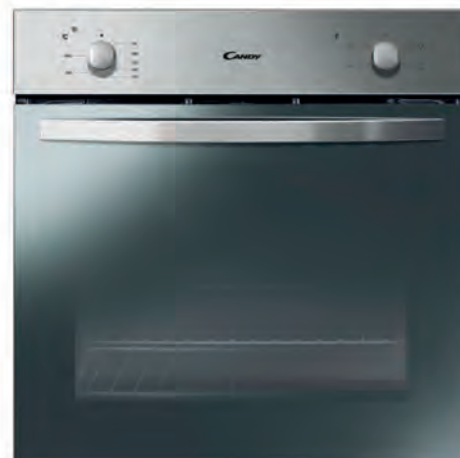
HORNO CANDY 159€

C63TPSC/E1 Inducción. 3 zonas. Zona Flex. 9 niveles de potencia + booster. Temporizador. Cód. 128426