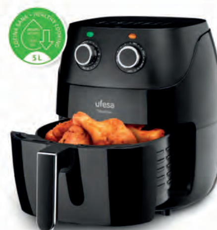
FREIDORA UFESA 99€

INCEPTION Peso máximo 180 kg. Peso mínimo 3 kg. Diseño resistente. Superficie de uso 28x28 cm. Fácil lectura. Activación automática. Cód. 126645