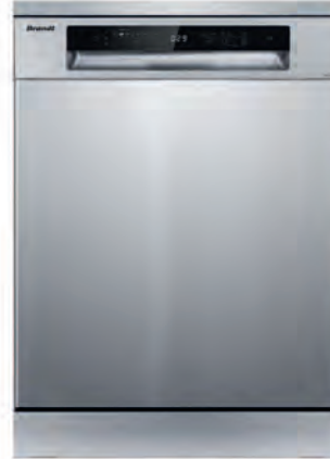
LAVAVAJILLAS BRANDT 489€

NW82C 8 kg. Condensación. Clasificación energética B. Control electrónico. Sensor de secado. Luz interior. Posibilidad de conexión a desagüe. Cód. 127873