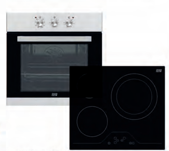
CONJUNTO HORNO + ENCIMERA NEW POL 389€

NWF1851PF (blanco) NWF1851PIF (inox) Vertical. Clasificación energética F. 7 cajones transparentes. Capacidad 280 litros. Dimensiones 186x59,5x65 cm. Cód. 124557/123743