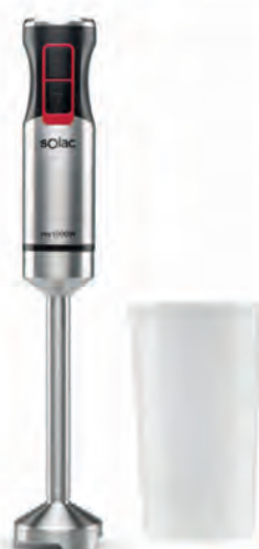
BATIDORA SOLAC 29,90€

LM8012/65 L'OR Barista. Prepara 2 cafés a la vez o 1 café doble en una taza. Volúmenes de café ajustables de 25 ml a 220 ml. Incluye 50 cápsulas. Cód. 128138