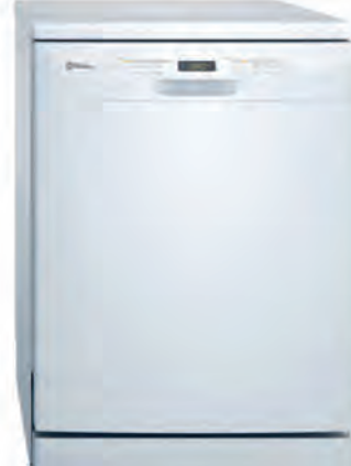
LAVAVAJILLAS BALAY 529€

BDF534DX 15 servicios. 8 programas. Clasificación energética D. 3ª bandeja. Inicio diferido. Programa higiene. Cód. 125956