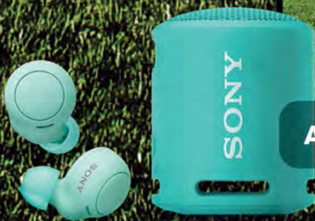
AURICULAR WIRELESS SONY