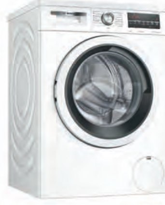
LAVADORA BOSCH 489€

WFB184QWP 8 kg. 1.400 r.p.m. Clasificación energética B. Motor Inducción. Ojo de buey ahumado. Display. Programa higiene 60°. Programa limpieza tambor 90°. Cód. 125952