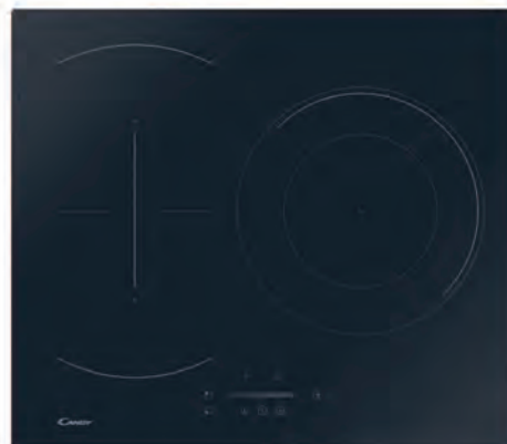
ENCIMERA CANDY 229€

CH63CC/4U2 Vidrocerámica. 3 zonas. Panel de mandos central. Cód. 127925