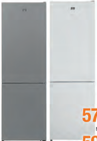
COMBI NEW POL 579€ 599€

WFO 3T142 X 14 servicios. 10 programas. Clasificación energética C. Display. Inicio diferido. Cód. 119609