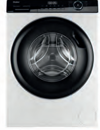
LAVADORA HAIER 499€

WUU24T61ES 9 kg. 1.200 r.p.m. Clasificación energética A. Motor EcoSilence. Display LED con recomendación de carga. SpeedPerfect. Tapa extraíble. Cód. 126489