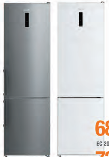
COMBI BRU 689€ 725€

NWC186EE (blanco) NWC186EEI (inox) No Frost. Clasificación energética E. Tirador integrado. Dimensiones 186x59,5x60 cm. Cód. 123739/123740