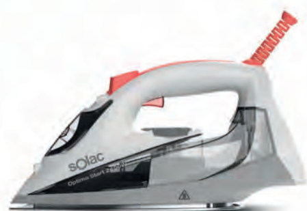
PLANCHA SOLAC 21,90€

DG9161 2.800 W. Suela Microsteam 400HD. 7,6 Bares. Salida de vapor continua de 140 g/min. Golpe de vapor 470 g/min. Depósito extraíble. Cód. 119216