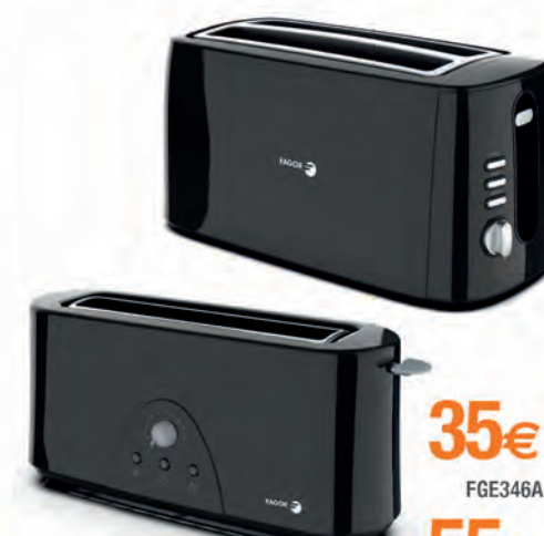
TOSTADOR FAGOR 35€ 55€

20.6000 130 W. Palanca metálica de presión. Cono de acero inoxidable. Incorpora filtro. Antigoteo. Cód. 124714