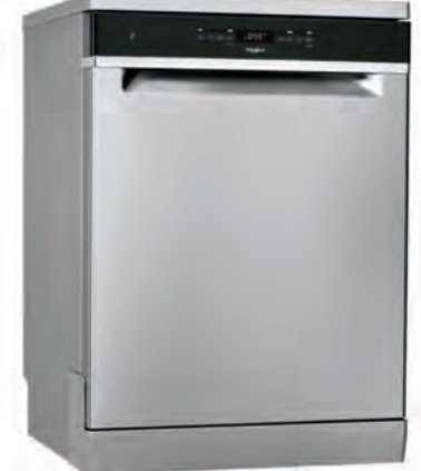
LAVAVAJILLAS WHIRLPOOL 569€

3VS5330BP 13 servicios. 5 programas. Clasificación energética E. 3ª bandeja. Motor ExtraSilencio. Control remoto vía App Home Connect. Cód. 119551