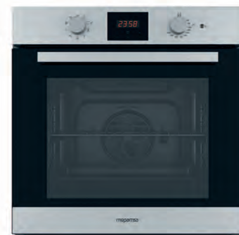
HORNO MEPAMSA 269€

FCS 100 X Multifunción (4 funciones). Inoxidable. Clasificación energética A. Capacidad 71 litros. Cód. 104428