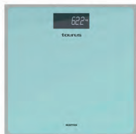
BÁSCULA BAÑO TAURUS 14,90€

PV2004 OPTIMA 2.400 W. Caudal vapor 30g/min. Golpe vapor 120g/min. Función autolimpieza. Suela cerámica. Cód. 121116