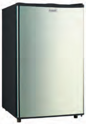
CONGELADOR FRIGELUX 239€

GBB71SWVCN (blanco) GBB71PZVCN (inox) Clasificación energética C. Door Cooling. Metal Fresh. Cajón Fresh Converter (regulable de -2 °C a 3 °C). Fresh Balancer con Magic Crisper. Display LED Interior. Iluminación LED. Dimensiones 186x59,5x68,2 cm. Cód. 121831/127528