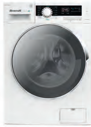
LAVADORA BRANDT 449€

CSO 14105TE/1-S 10 kg. 1.400 r.p.m. Clasificación energética E. 16 programas. Ciclos rápidos. Inicio diferido. Conectividad mediante app. Cód. 118268