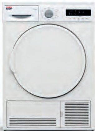
SECADORA NEW POL 369€

HW100-B14939-IB 10 kg. 1.400 r.p.m. Clasificación energética A. Motor Direct Motion. 15 programas. Opción Vapor. Cód. 126981