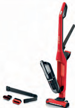
ASPIRADOR ESCOBA BOSCH 259€

BBHF220 18 V. 2 en 1: aspirador escoba y aspirador de mano. 2 niveles de aspiración. Autonomía hasta 40 minutos. Cepillo HighPower. Cód. 120195