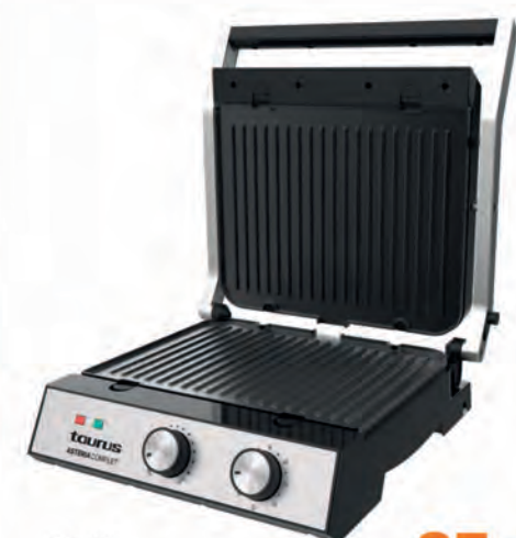
GRILL TAURUS 85€

SHADOW Sin aceite. 1.500 W. Capacidad 5 l. Temperatura hasta 200 °C. Control manual de tiempo y temperatura. Tecnología 360° de circulación de aire a alta velocidad. Cuerpo y asa de tacto frío. Cód. 127524