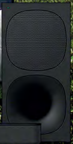
BARRA DE SONIDO SONY