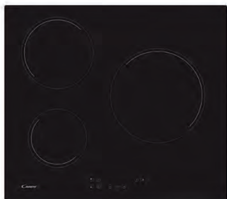
ENCIMERA CANDY 159€

CH63CC/4U2 Vidrocerámica. 3 zonas. Panel de mandos central. Cód. 127925